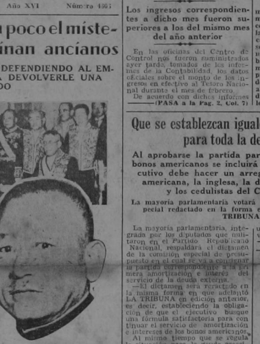
El general Watanabe, asesiinado.

Vasto plan para atraer el turismo hacia la isla del Coco, esboza el capitán Polkinghorne