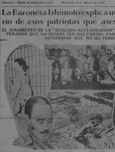
1. La baronesa Ishimoto. 2. Ultima fotografia del gabinete Okada. 3. El general Watanabe, asesiinado. 4. El Almirante-Teniente Okada. 5. Estacion de Tokio que fue ocupada por los terroristas. 6. Tunaño Goto. Prencion por unas cuantas horas