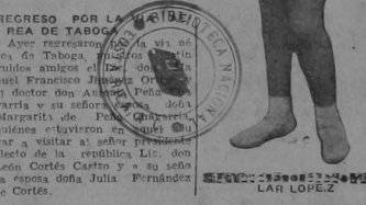
REGRESO POR LA MARIBARRIA DE TABAGO...