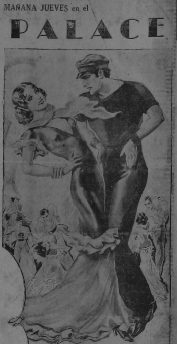
La primera musical en español que introduce una danza sensacional!

MANANA JUEVES en el PALACE ¡LA BAMBA! Bañada por 100 parejas!! TOTALMENTE HABLADA Y CANTADA EN ESPAÑOL ENTRADA ... 50 Cts.